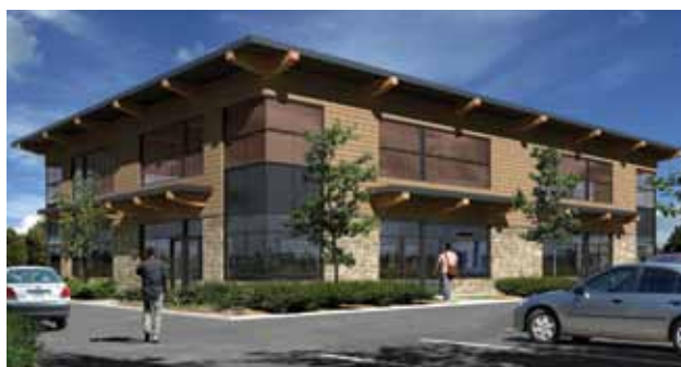
Centre professionnel Le Corbusier

En tout cas, l'idée plaît à la communauté d'affaires. Quelques semaines après la première pelletée de terre, Construction Bonzaï a déjà vendu une douzaine de ses unités. C'est la confirmation dont avait besoin l'entrepreneur pour donner le coup d'envoi à un plus vaste projet de condominiums commerciaux.