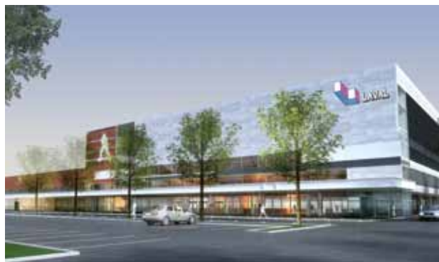
Le futur Complexe multifonctionnel culturel et sportif de Laval.

Inspiré des amphithéâtres ultramodernes de Vancouver, Toronto et Chicago, le concept préliminaire du complexe lavallois se veut avant tout polyvalent. Ainsi, l'une des glaces sera dotée de 7000 places pour les matchs de hockey, nombre qui pourra augmenter à 10 000 lorsque le lieu sera converti en salle de spectacles. Une glace de dimension olympique, avec des estrades pour asseoir 2500 spectateurs, pourra accueillir des compétitions de patinage de vitesse courte piste et de patinage artistique. La troisième glace accueillera les pratiques des équipes de hockey et de ringuette ; 250 spectateurs pourront prendre place dans les gradins. Dans les autres locaux du complexe logeront un gymnase, un centre de médecine sportive, un magasin d'articles de sport ainsi que des bureaux administratifs et un stationnement intérieur de 200 places. D'autres locaux encore pourront être loués à des organisations – boutiques, restaurants, etc. – susceptibles d'améliorer l'offre de services.