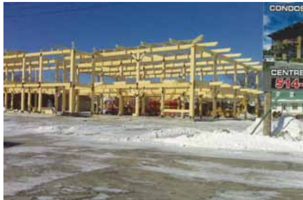
Structure en bois d'un bâtiment de condos commerciaux de deux étages, une initiative de Construction Bonzaï (voir page 6).

Autre caractéristique : la solidité du matériau. Le bois étant séché et reséché, il ne présente plus qu'un taux d'humidité de 10 % lorsqu'il est transformé. Bref, il ne « travaille » plus. Précisons que le Code du bâtiment approuve l'utilisation de la charpente en lamellé-collé pour les bâtiments commerciaux et industriels de quatre étages ou moins, nombre qui devrait être augmenté à six sous peu.