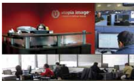
Siège social d'Utopia Image à Laval.